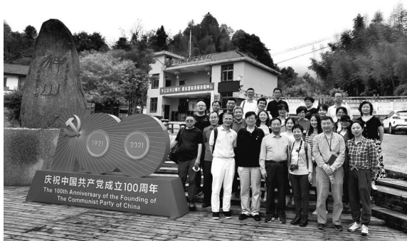
习总书记视察过的井冈山市茅坪镇神山村