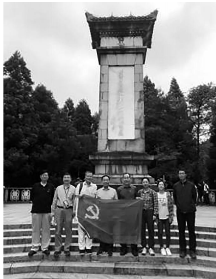
全体人员及两个支部在《西江月·井冈山》碑前合影