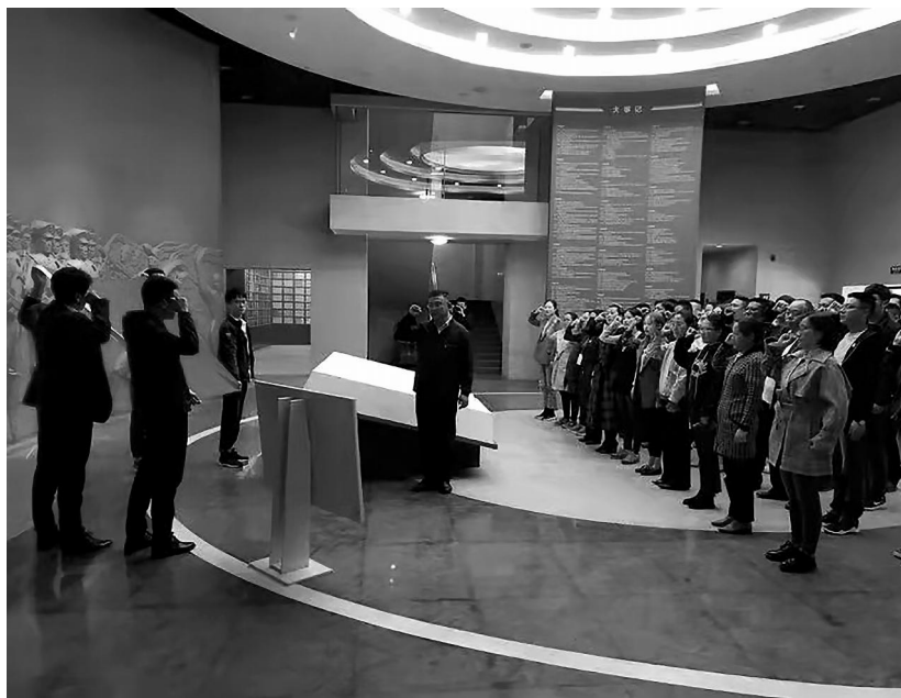
参观西藏军区军史馆

地估价师协会。西藏土地估价师协会成立以来，在行政主管部门的指导下，落实行业管理，严格行业会员自律，规范机构行为，提高技术服务能力，对规范土地评估市场和促进行业健康快速发展提供了强有力的支撑。2019年，根据西藏自治区党委组织部的文件要求，在自然资源厅党组的领导下，西藏土地估价师协会成立了党支部，在自然资源厅派遣的党支部辅导员的指导下，完善了组织结构，进行了一系列的党建活动，参观西藏军区军史馆，组织学习党史党章，学习习总书记西藏工作座谈会讲话精神，走访贫困户……通过这一系列活动，协会党员学习了“两路精神”，深刻领会了特别能吃苦、特别能战斗、特别能忍耐、特别能团结、特别能奉献的“老西藏精神”，加强了凝聚力，增强了党性，强化了党对“两新”阶层的领导。根据国务院、西藏自治区自然资源厅相关文件精神，2020年8月进行了脱钩改制。经过一系列的改革，西藏土地估价师协会增强了活力，提高了协会为政