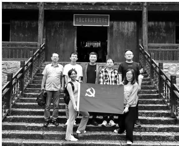
中共上海上睿房地产估价有限公司支部党员 与入党积极分子合影

在茨坪革命旧址群，体会当年红军真心实意为民的革命宗旨。茨坪是井冈山革命根据地党政军最高指挥中心所在地。中共井冈山前委、红四军军部、湘赣边界防务委员会、军官教导队、军械处、公卖处等重要机构都设在这里。