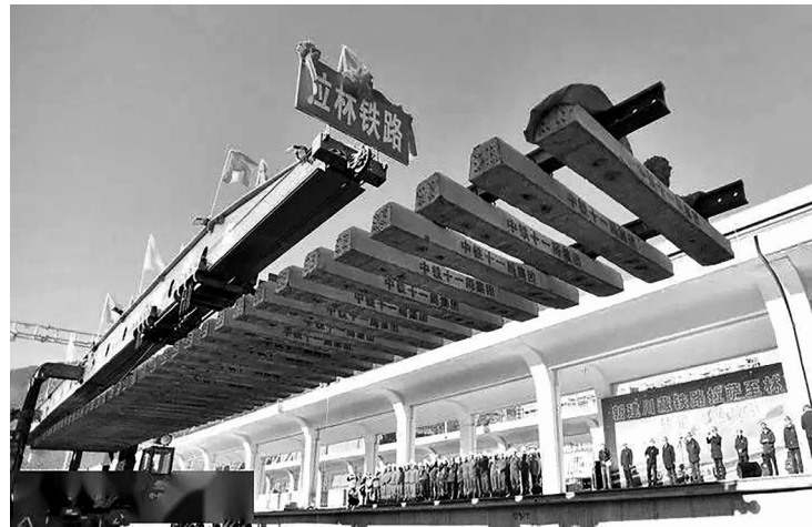
川藏铁路拉萨—林芝段铺轨完成

结一心、艰苦奋斗，解决了很多长期想解决而没有解决的难题，办成了很多过去想办而没有办成的大事，各项事业得到了史无前例的发展和提升，西藏和平解放70年，成为西藏历史上发展最好最快的时期。