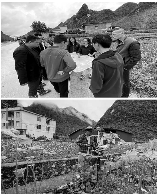
体悟初心，把握民意绘蓝图

以公司承接的中国国家铁路集团有限公司广西境内铁路用地资产授权经营评估项目为典型，在“党旗领航+”思路主导下，