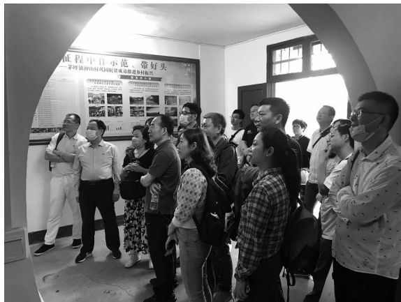
在神山村党建服务中心观看习总书记视察该村的视频

在小井红军医院，聆听曾志、张子清等同志的革命事迹，真切感受到当年战争的残酷和红军战士坚定的革命信仰。