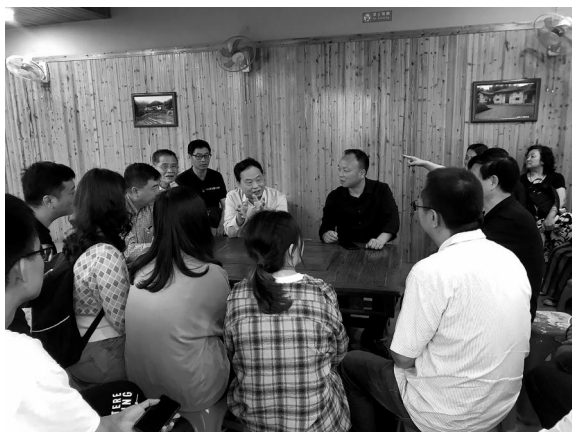
与神山村党支部书记座谈