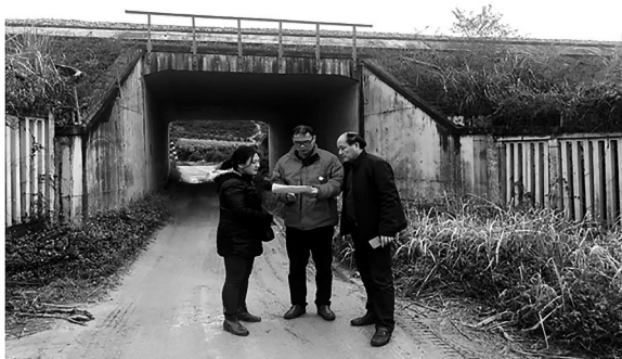
把握根本，夯实基础扎实践行

各部门的工作积极性、创造性得到显著激发，工作质量、效率与团队精神面貌均得到客户的认可。通过“党旗领航+提升流程管控”，无论是前期方案制定、评估基础资料分析审核，中期外业查勘、技术难点攻关，还是后期分析测算与报告撰写，都凝结了全体成员的担当与责任，经集体智慧汇集形成的作业管控流程提升方案，为预期工作成效的取得起到关键作用；通过“党旗领航+技术创新保障”，在一线作业人员奔赴广西全境各市、县区，翻越山岭、穿隧道过桥梁进行现场踏勘，以及采集数据信息汇集处理的进程中，由生产部门与研发团队共同设计、研发的智能移动终端“外业勘查与信息管理系统”发挥了重要作用，做到了勘查对象精