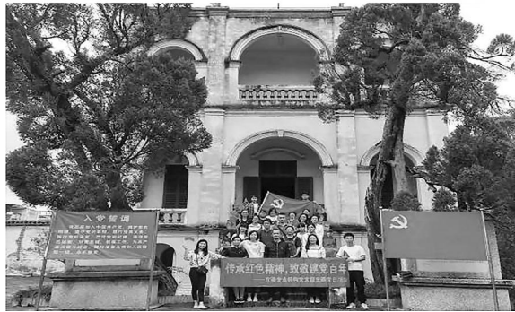
重温党史，重走圣地

在红八军军部旧址的红军井旁，大家聆听着当年的故事，恍如穿越时空，再次走进那段峥嵘的岁月，感悟“人民的党为人民”的初心与使命。在法式小楼前，由小平同志于1930年亲手栽下的两棵柏树依旧苍劲挺拔，红色精神，始终焕发着传承的勃勃生机。